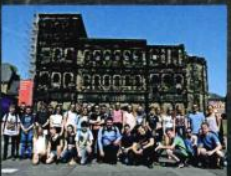
Exkursion der Lateinkurse (Jg. 8) nach Trier (oben) und Abschlussfahrt (Jg. 10) nach Berlin (unten)