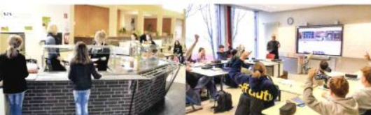
Mittagessen in der Mensa

Zusätzlich werden in dieser Zeit Arbeitsgemeinschaften und Förderunterricht angeboten. Die Teilnahme an den Ganztagsangeboten an einzelnen oder mehreren Tagen ist freiwillig, individuell wählbar und selbstverständlich kostenlos. Gelegenheit zum vollwertigen Mittagessen gibt es in der Mensa.