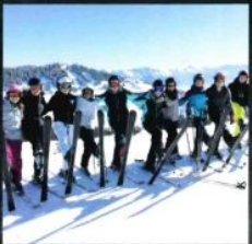
Skifahrt im Jahrgang 9