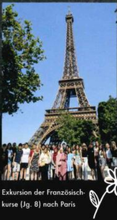
Exkursion der Französischkurse (Jg. 8) nach Paris