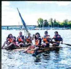
Klassenfahrt im Jahrgang 6