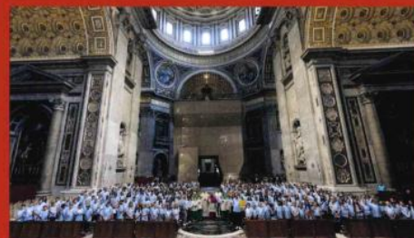
Eine starke Gemeinschaft - das LSG im Petersdom in Rom 2024

GERNE BEGRÜßEN WIR IHRE KINDER UND SIE ALS TEIL UNSERER SCHULGEMEINSCHAFT ZUM NEUEN SCHULJAHR.